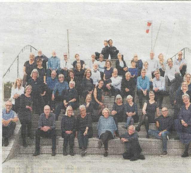
Septimuskoret, Svendborg-chor, på Bølgen i Svendborg.