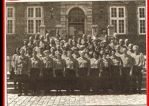
Septimus koret synger julen ind i Vor Frue Kirke.