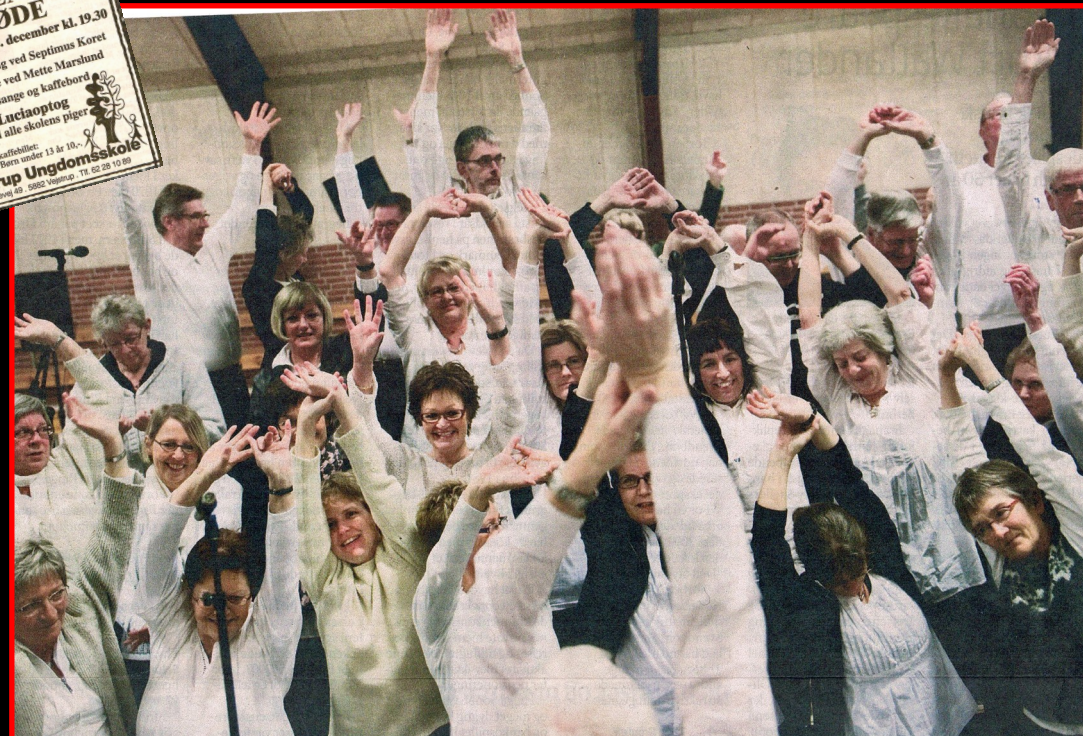
Septimuskoret på fuld udblæsning - også når det gælder en god opvarmning. Denne eftermiddag som en sidste prøve før koncerten på Vejstrup Efterskole - på søndag gælder det årets julekoncert i Fredens Kirke i Svendborg.