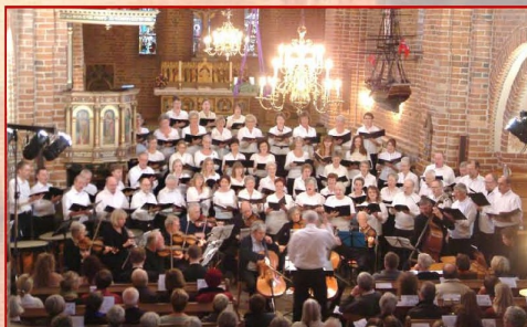
Septimus koret www.septimus.dk