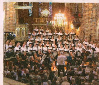
Septimuskoret medvirker ved den store kirkekoncert, som fremføres både lørdag og søndag.

Teksten til et requiem er på latin og stammer fra den katolske messe for de døde. Ordene er blevet sat i musik af utallige komponister de sidste 5-600 år. Gabriel Fauré gjorde det på en måde, der vakte debat i fransk musik dengang i 1880'erne. Han blev kritiseret for at forholde sig for frit til traditionerne og være for blødsoden. Katolske høge an-