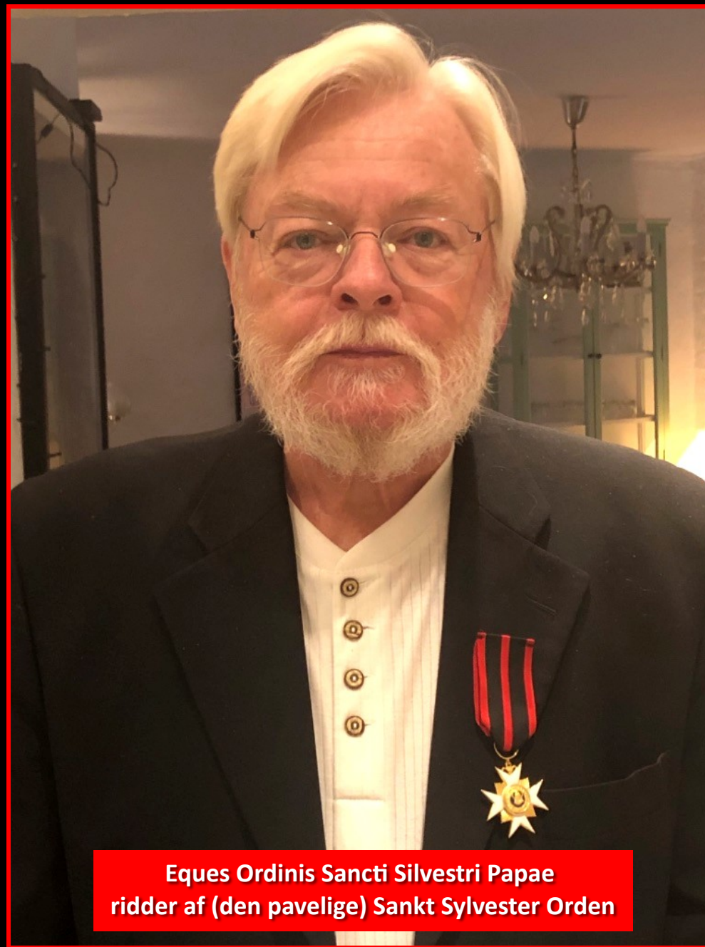
Eques Ordinis Sancti Silvestri Papae ridder af (den pavelige) Sankt Sylvester Orden