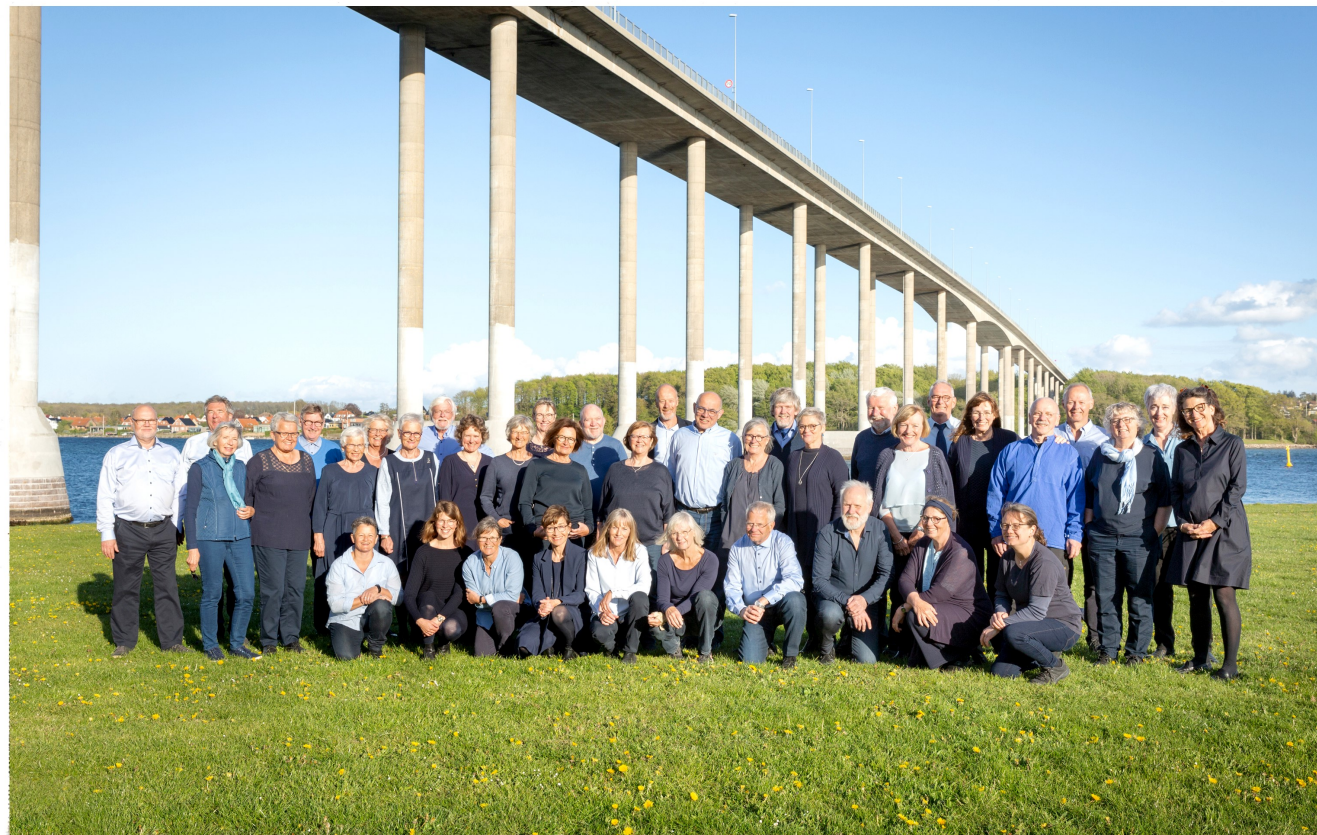
Septimus-koret synger Carl Nielsen i Faaborg Kirke 27. februar.

Septimuskoret i Svendborg og korets dirigent, musikhi-