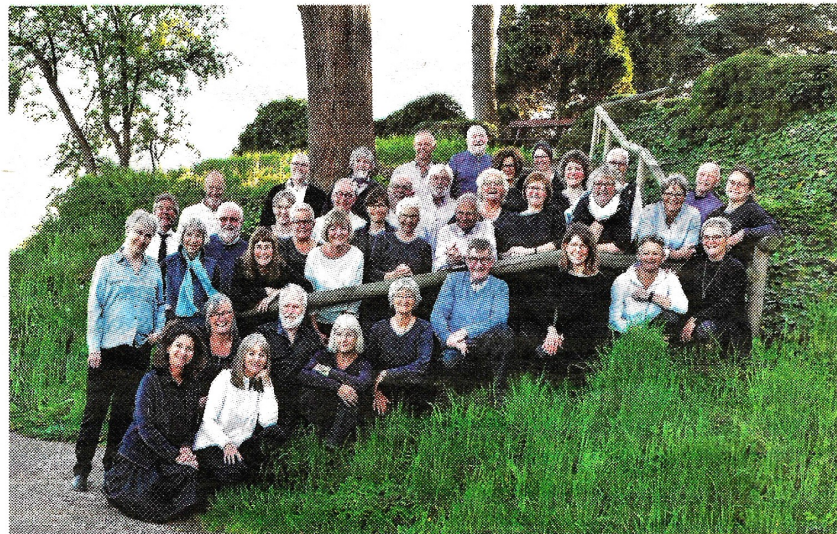
Septimuskoret kan opleves i en koncert den 30. august.