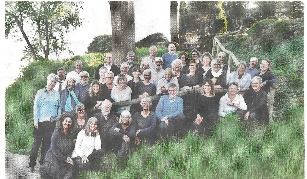
Septimuskoret kan opleves i en koncert den 30. august.

Septimuskoret holder dog snigpremiere på Carl Nielsen-projektet på Kultur nat ten i Svendborg 30. august.