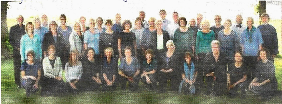
Septimuskoret synger deres rejseprogram, når de giver koncert i Vor Frue Kirke 23. maj.