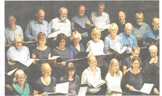
★ Septimus Koret er et af mange lokale kor, der deltager i årets SyngSydlyn.

Men først gælder det årets festival med koncerter med bl.a. vokalsensemblet Glas på Arne og flere lokale korkoncerter