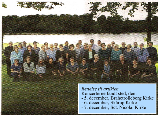
Septimuskoret løfter stemmernes i Sct. Nikolai Kirke i Svendborg, onsdag 7. december.

Septimuskoret har - som dets publikum igennem de sidste tre år vil vide - flere gode traditioner. Koret arbejder tematisk, man holder de klassiske korværker i hævd, samtidig med at man ved hver eneste koncert præsenterer publikum for mindst én uropførelse. Koret lever ved