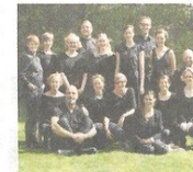
★ Et af Københavns bedste kor, Laetitia Musica, besøger og synger i Svendborg i forbindelse med SyngSydlyn.

Gruppen bag festivalen sidder i øjeblikket og planlægger næste konkurrence, som løber af stabelen i forbindelse med næste års festival. En konkurrence, som opgraderes, og som vil have absolut topkordirigenter som dommere. Der vil være deltagere fra flere lande end sidst - deltagerne vil komme fra hele Nordeuropa og konkurrencen er derfor døbt 'Northern Choir Conducting Competition'.