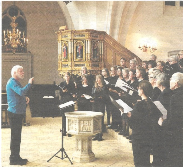
★ Septimus-koret holder forårskoncert i Vor Frue Kirke den 30. maj.

P.E. Lange-Müller er kendt som vokalkomponist af en række udtryksfulde solosange med klaverakkompagnement; der er desværre kun alt for få korværker i hans samlede produktion. Dette har Septimus-koret rådet bod på ved at udsende et hæfte med korarbejdsblade af syv af hans smukke sange - af disse præsenteres fire ved koncerten,