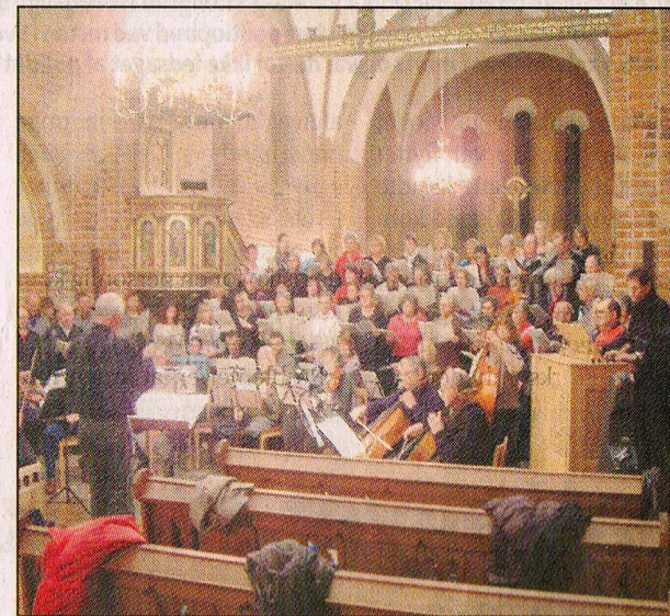
Musisk Aftenskole og Vester Skerninge Sangkor arrangerer koncert sammen med Septimuskoret, der her ses til en koncert-prøve i Sct. Nicolai Kirke.

Søndag 16. november: OD-Hallen kl. 15.00 (dørene åbnes kl. 14.00)