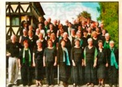
SeptimusKorets forårskoncert finder sted den 22. maj

Tappenstreg blev normalt spillet af et militærkorkester, men her bliver det fremført på helt traditionel vis af SeptimusKorets medlemmer. Udgaven er faktisk lettere vanvittig, men kom selv og bedøm den. Forannavnte numre er kun en del af det samlede koncertrepertoire. Der er mange andre gode sange i fine arran-