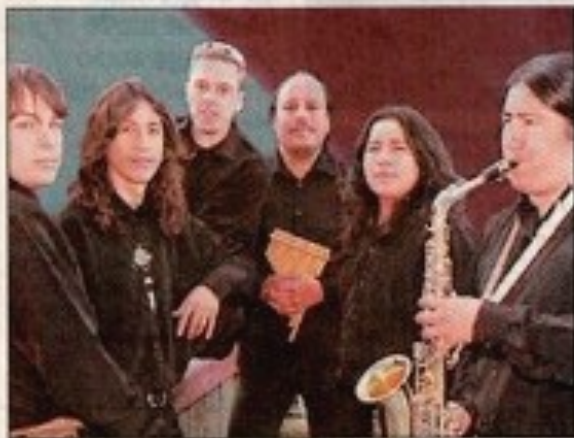
Titicaca ensemblet synger sange fra Andesbjergene.