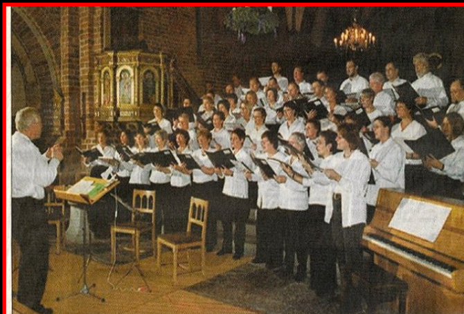
Septimuscorets 50 stemmer synger for, når Sankt Nicolai Kirke på søndag holder julekoncert.

2 Julekoncerter i 2002 Sct. Nicolai Kirke og Gislev Kirke