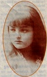
CIRKUSPRINSESSEN: Elvira Madigan i linedanserkostume.