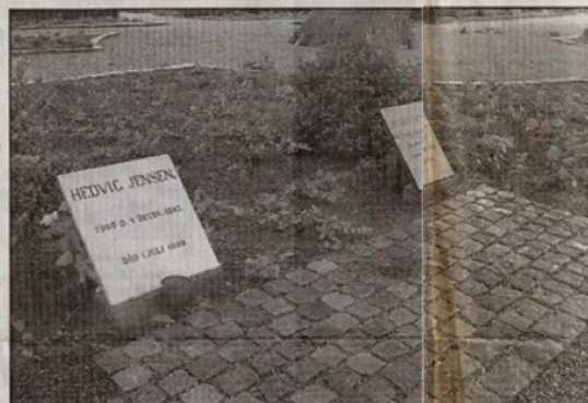
På Landet Kirkegård fandt linedanseren Elvira Madigan, der i virkeligheden hed Hedvig Jensen og hendes grev Sparre endelig hvile. Parret får nu igen liv i musik og tekst i et nyt børnekorværk.